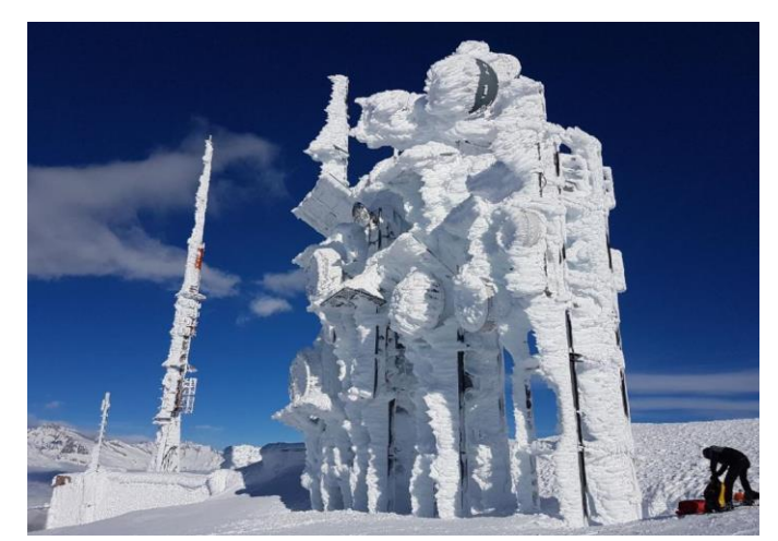
Im Januar haben zwei Stürme den Einsatz der Salt Monteure erfordert, um zahlreiche Antennen von grossen Schneemengen zu befreien.

Wir unternehmen alles, um eine herausragende Servicequalität und -verfügbarkeit für unsere Kunden zur gewährleisten. In diesem Winter haben unsere Mitarbeiter viele Stunden lang Antennen und Basisstationen von zum Teil vier Meter hohen Schneemassen befreit. Das war von zentraler Wichtigkeit, um in abgelegenen Gegenden die mobile Verbindung sicherzustellen.